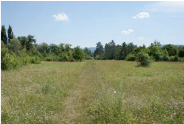
3) Trockenwiese in der Reinacherheide (Reinach)