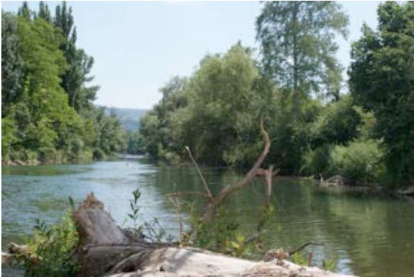
1) Revitalisierte Birs (Arlenheim / Reinach) Foto: Fankhauser, Architekt