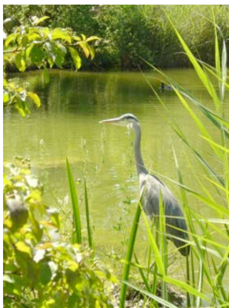
15) Fischreiher