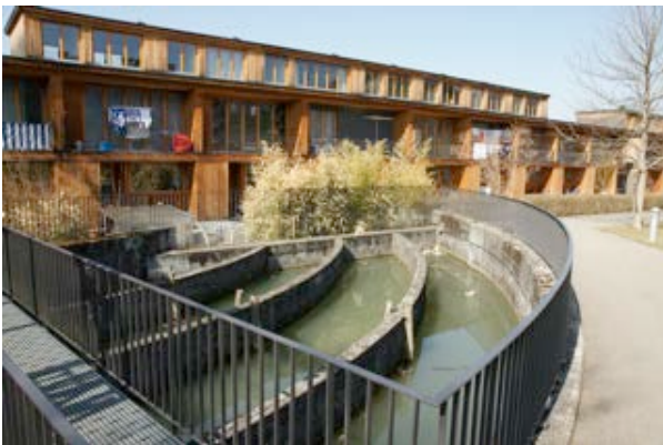
9) Ehemaliges Einlaufbauwerk der Schappe-Spinnerei (Arlesheim)