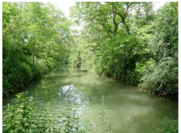
6) Naturschutzgebiet (Arlenheim) Foto: Fankhauser Architekt