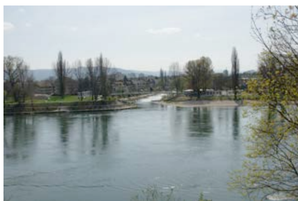
14) Birskopf (Birsfelden / Basel)