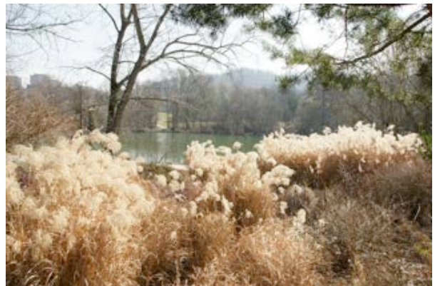
10) Park im Grünen (Münchenstein)