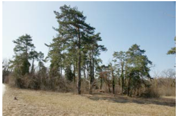
4) Reinacherheide (Reinach)