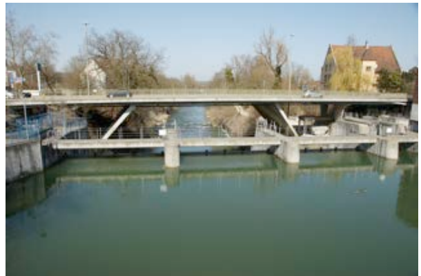
8) Kleinkraftwerk Dornachbrugg