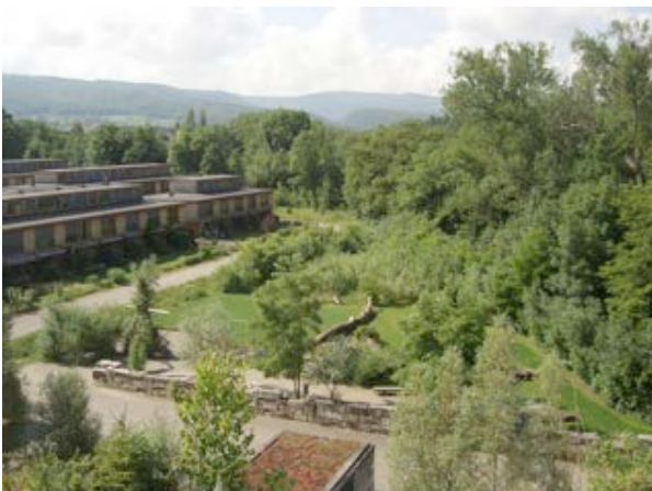
5) Wohnbauten am Rand des Naturschutzgebietes (Arlenheim)