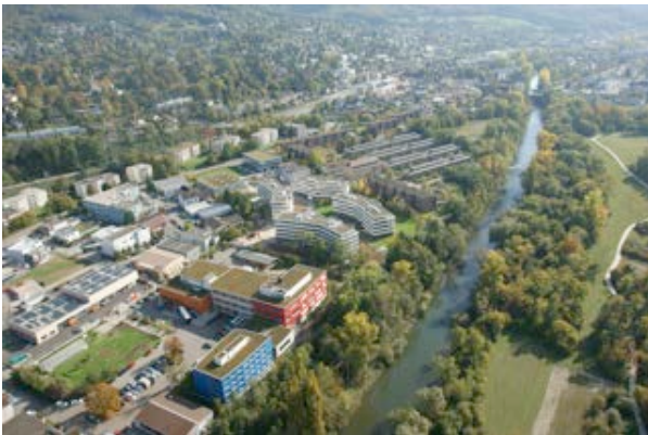
7) Gewerbe- und Wohnbauten am Birsufer (Arlesheim) Foto: Fankhauser Architekt