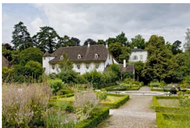
13) Brüglingerhof (Münchenstein)