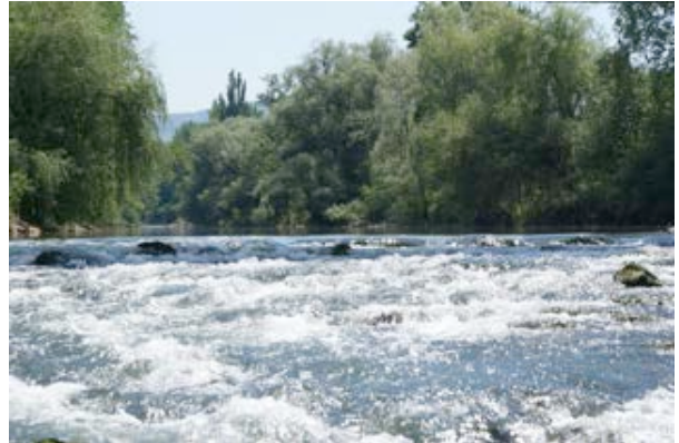
2) Revitalisierte Birs (Arlenheim / Reinach) Foto: Fankhauser, Architekt