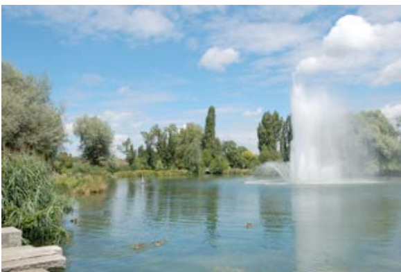
11) Park im Grünen (Münchenstein)