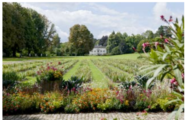
12) Merian-Gärten (Münchenstein)